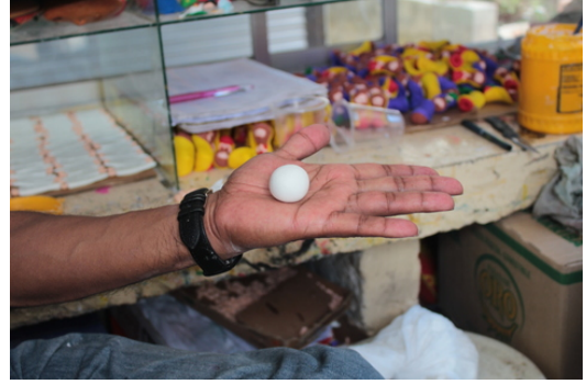
Figura geométrica base para una gran cantidad de figuras de