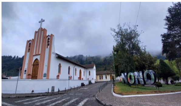
Mantenimiento del espacio público en las áreas históricas de las parroquias rurales (Nono).