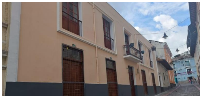
Palacio de Carondelet

Rehabilitación del inmueble ubicado en la calle morales.