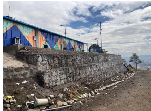
Intervención integral panecillo