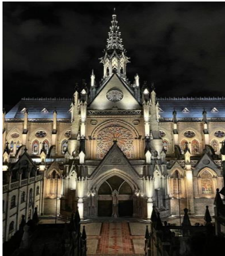
Iglesia de la Basílica del Voto Nacional