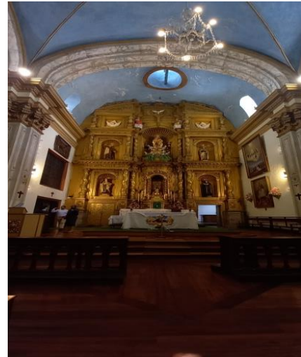
Iglesia del Carmen Alto