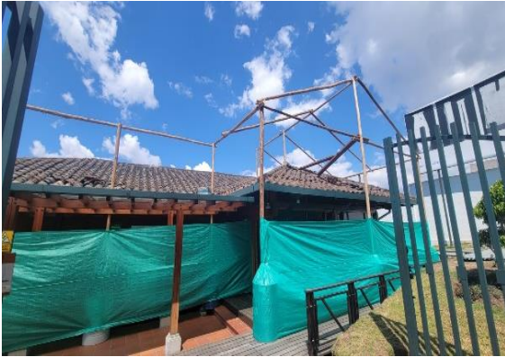
Museo de sitio La Florida