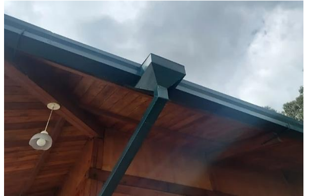
Museo de sitio Tulipe y Rumipamba