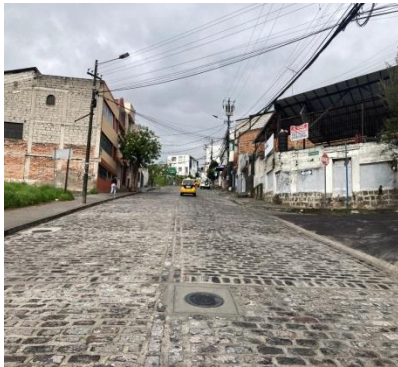
Intervención integral pasajes y calles de piedra del CHQ