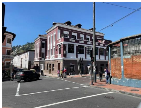
Dirección: Montufar y Sucre Recuperación de Fachada (Recuperación de Imagen Urbana-RIU).