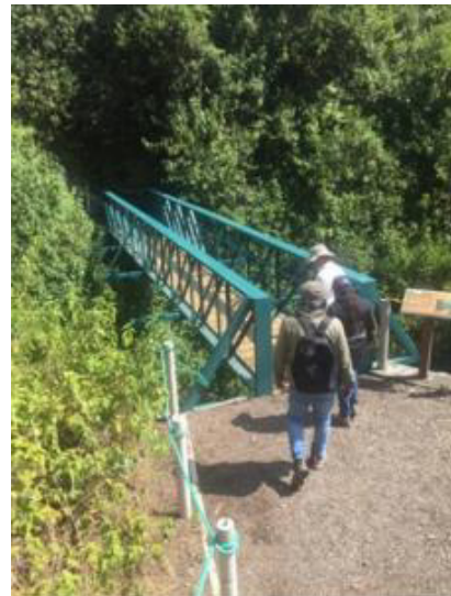
Trabajos ejecutados en el acceso cambio de postes de madera por de hormigón, cambio de maderas del puente – Rumipamba