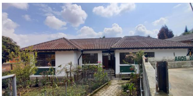
Edificio patrimonial Años Dorados (Fase III).