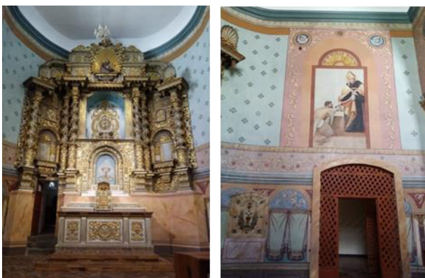
Conservación y restauración de bienes muebles patrimoniales, mantenimiento del sistema eléctrico, implementación de luminarias - Iglesia Agustinas de la Encarnación. 24