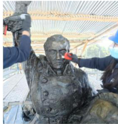
Conservación de bienes artísticos escultóricos ubicados en el espacio público del DMQ (conjunto escultórico del Libertador Simón Bolívar).