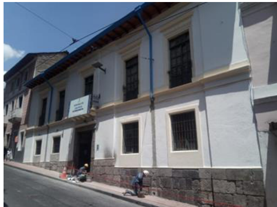
Intervención Casa Mejía – Centro Histórico