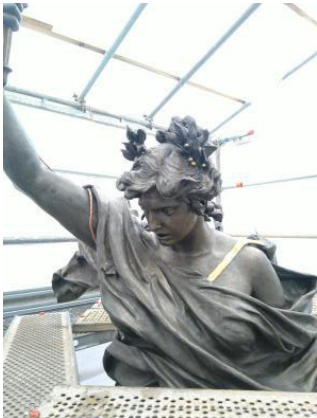
Conservación integral del Monumento a la Libertad en la Plaza grande.

Hasta el mes de diciembre, la ejecución del proyecto ha superado lo planificado a llevarse a cabo durante el año 2022.