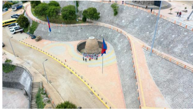
Intervención integral panecillo