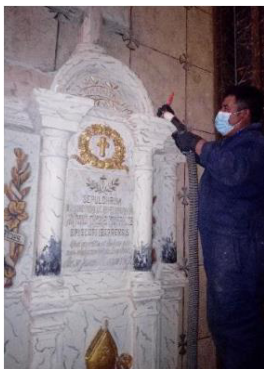
Conservación de bienes muebles de la Catedral Primada de Quito (Capilla de las Almas, epitafio norte).