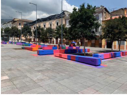
Rehabilitación del espacio Público boulevard 24 de mayo