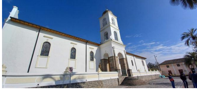
Mantenimiento del espacio público en las áreas históricas de las parroquias rurales (Amaguaña).