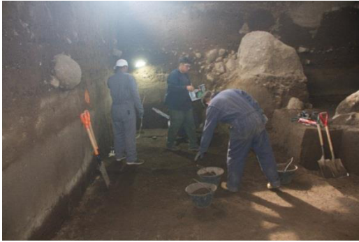
Excavación de contexto arqueológico

Hasta el mes de diciembre, el cumplimiento de la meta no se ha podido ejecutar de acuerdo a lo planificado para el año 2022.