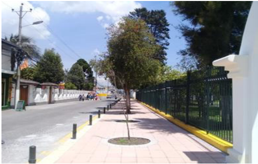
Intervención en el área histórica de la parroquia Chillogallo