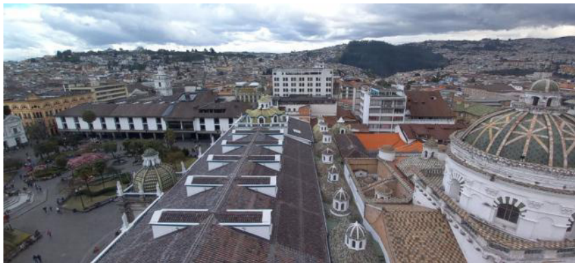
Iglesia Catedral Primada