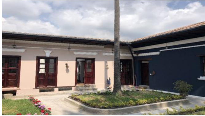
Dirección: Pasaje E3A N6-25 y Don Bosco Intervención en Cubierta (Quinta Fachada-QF), Recuperación de Fachada (Recuperación de Imagen Urbana-RIU), Mantenimiento Menor.