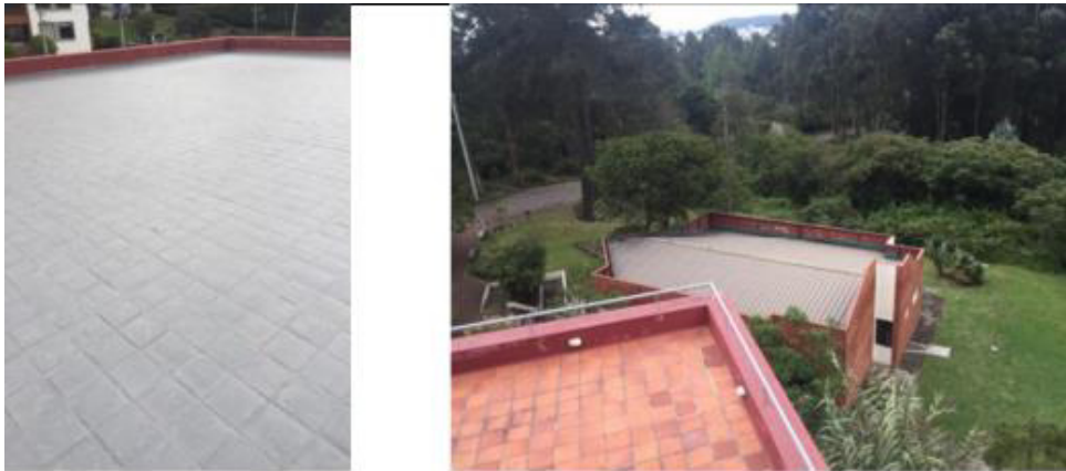
Impermeabilización de terraza, limpieza de cubierta y canales Casa Taller - Rumipamba.