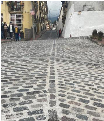
Intervención integral pasajes y calles de piedra del CHQ

Hasta diciembre de 2022, mes de cierre del año 2022, la meta establecida se ha logrado avanzar más de lo planificado inicialmente.