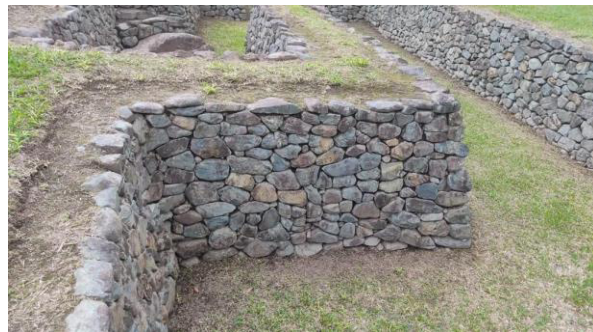
Conservación de los sitios arqueológicos administrados por el IMP – Tulipe