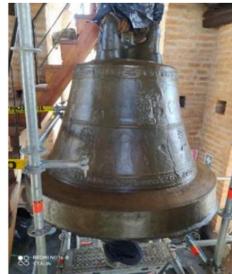
Conservación emergente de bienes muebles del DMQ (conservación de campana en la Catedral).