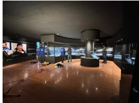
Implementación de diseño museográfico – Parque Arqueológico y Ecológico Rumipamba – Centro de Interpretación