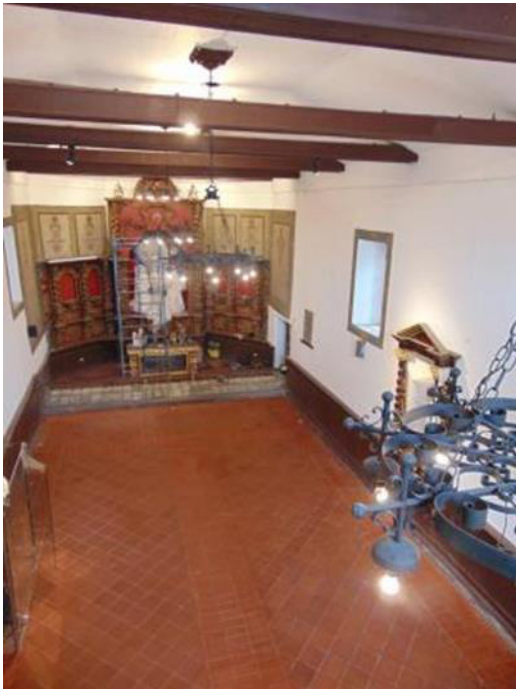
Iglesia el Belén

Para el año 2022 la meta fue cumplida según lo planificado.