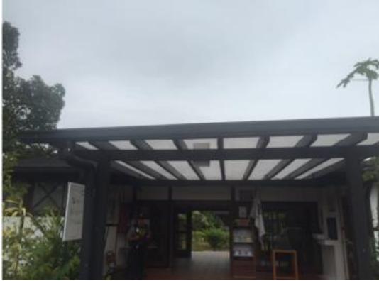
Mantenimiento de cubiertas – Complejo arqueológico Tulipe