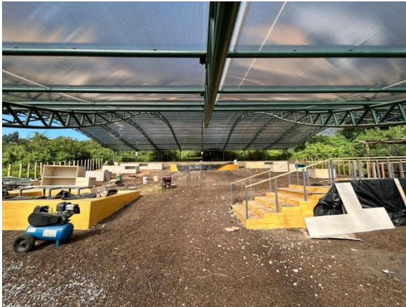
Implementación de área arqueológica lúdica para niñas y niños en unidad 6 - Parque Arqueológico y Ecológico Rumipamba – Centro de Interpretación